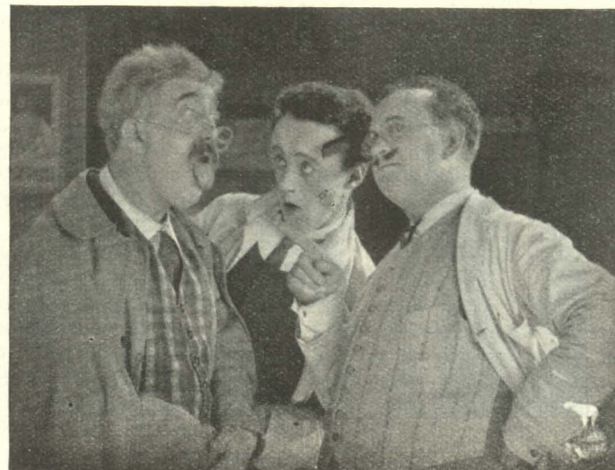
Værtens Sygdom konstateres.

Kummersen var ikke den Mand, der nægtede en skælvende Kvinde sin Bistand, og ved Hjælp af et Haartørringsapparat, som unge Berg