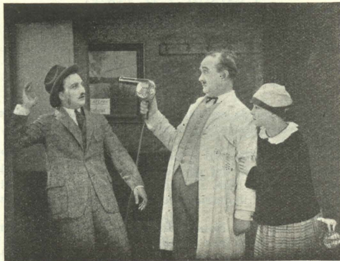
Den voldsomme Frier afvises.

Kummersen havde imidlertid Pengene, men da Værten kom for at hente dem, var det ham umuligt at finde dem. Han ledte alle Vegne, men Hundredekronesedlen var og blev borte. Saa fik han en god Idé,