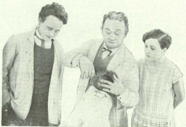
Undervisning i Haarkunsten.

Fagerberg havde lovet Kummersen, at han skulde faa Dessert, naar han kom hjem, men det var om Formiddagen. I Mellemtiden var hun blevet i daarligt Humør, og det blev kun „Læsedessert“ han fik. Hun